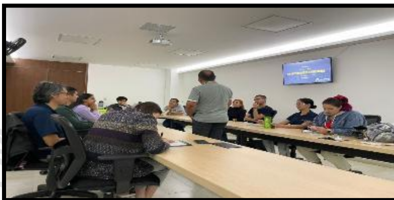
Foto 51 Capacitación Inteligencia Emocional