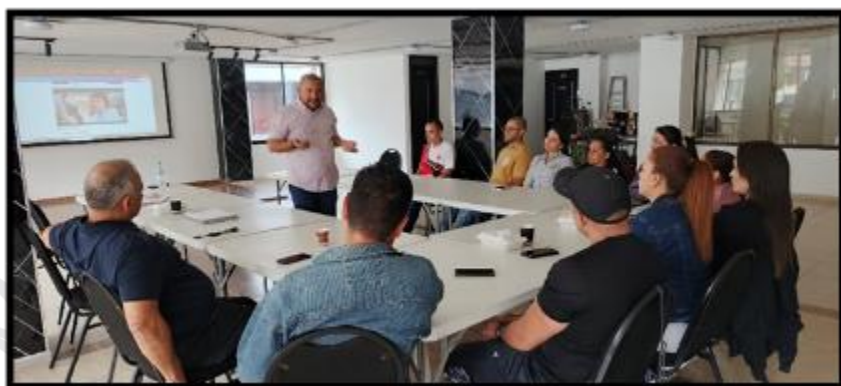
Foto 119 Capacitación servicio al cliente

Foto 118 Capacitación Servicio al cliente