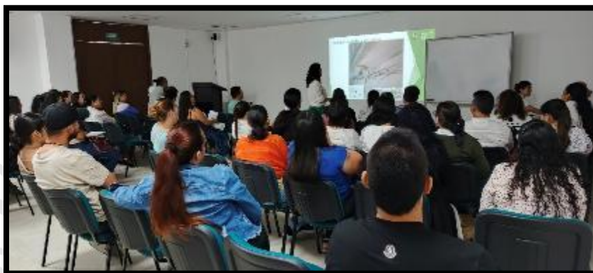
Foto 89 Capacitación de Manipulación de Alimentos