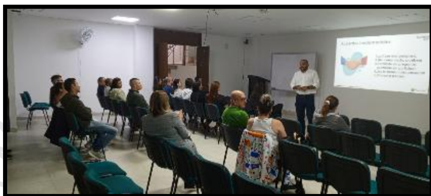
Foto 39 Capacitación Liderazgo con propósito