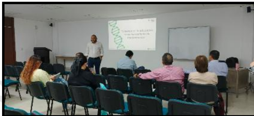
Foto 107 Capacitación Innova-Acción