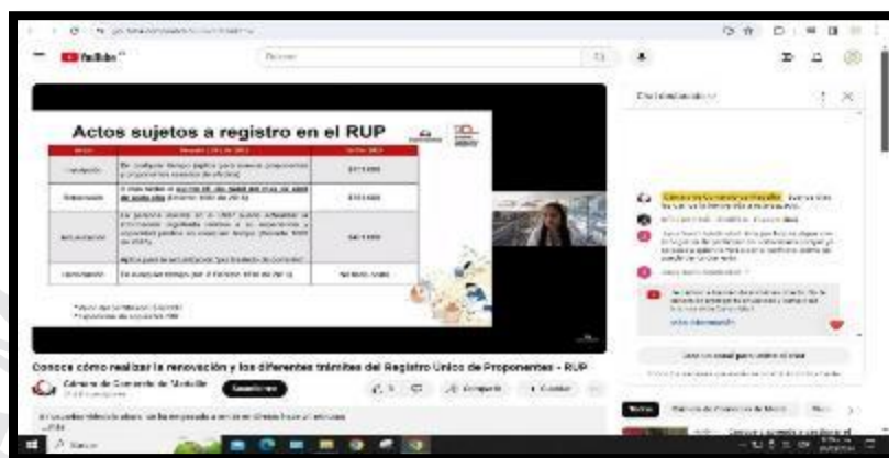
Foto 35 Capacitación Registro Único de Proponentes