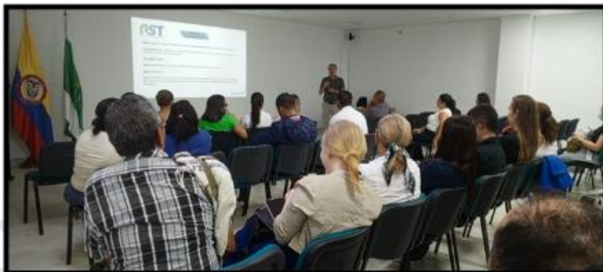
Foto 33 Capacitación Régimen Simple de Tributación