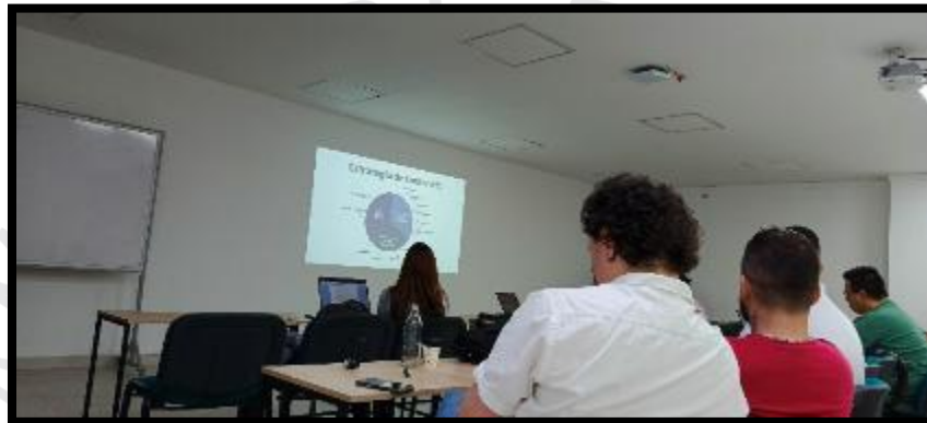
Foto 131 Capacitación Marketing digital Converzzo

Foto 130 Capacitación Marketing digital Converzzo