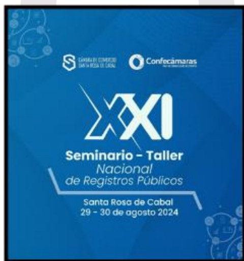
Ilustración 12 Logo del XXI Seminario Taller Nacional Registros Públicos