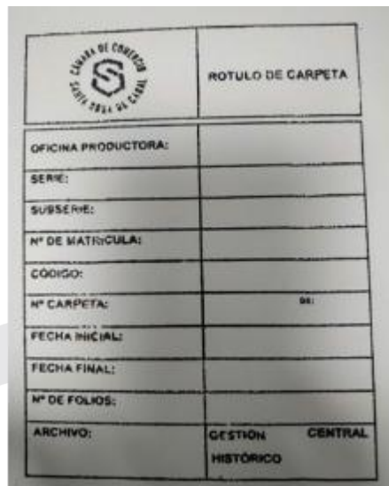
DESCRIPCIÓN ARCHIVÍSTICA DE EXPEDIENTES