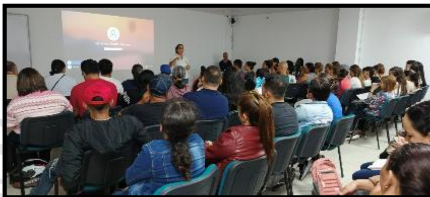
Foto 57 Capacitación Manipulación de Alimentos