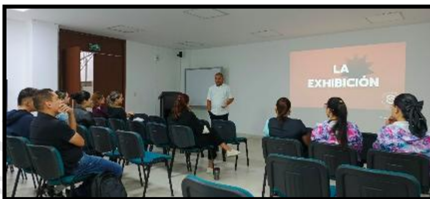
Foto 115 Capacitación Exhibición de productos