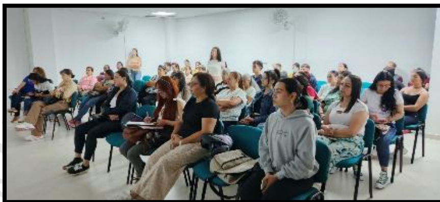
Foto 135 Capacitación Manipulación de alimentos