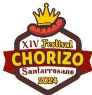
Ilustración 8 Logo Festival del Chorizo