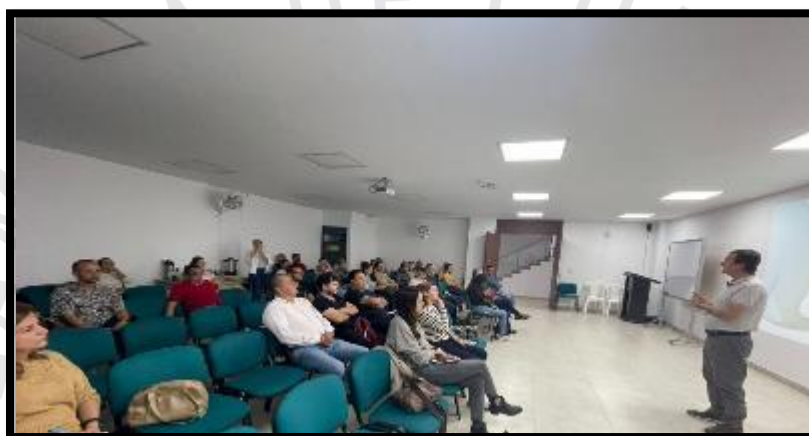
Foto 59 Capacitación Facturación Electrónica