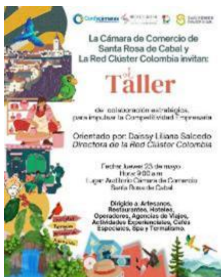
Foto 142 Capacitación Clúster