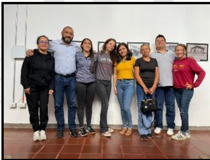
Foto 154 Ruta de acompañamiento al emprendedor Fase II

Se concluyó el programa con 7 emprendedores formados finalizando el proceso es sus fases.