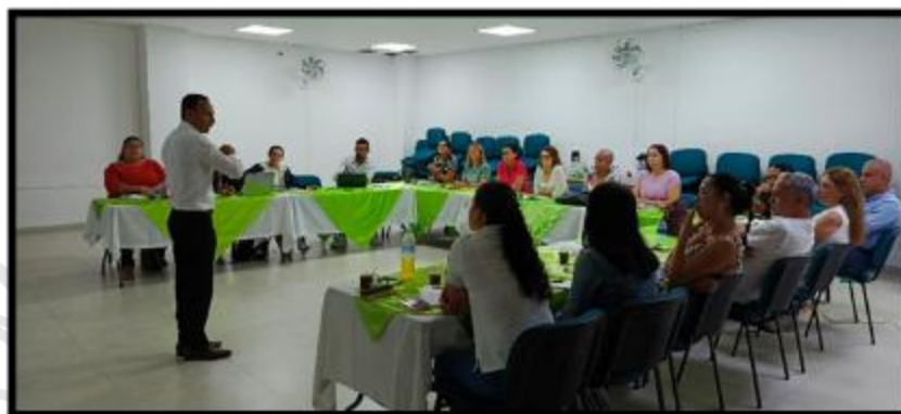
Foto 73 Capacitación Seminario impuesto de Renta personas naturales año gravable 2023