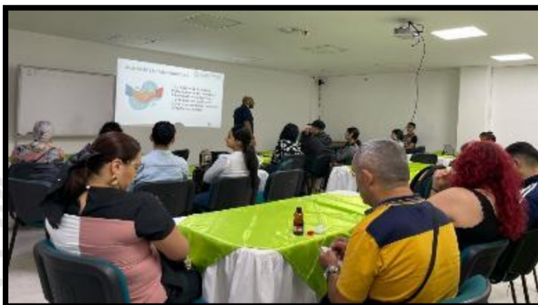
Foto 55 Capacitación Liderazgo Creativo