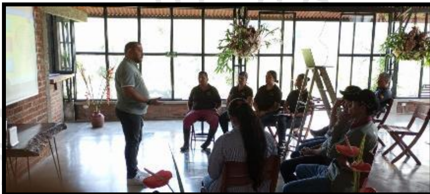
Foto 91 Capacitación Inteligencia Emocional - Cabaña la Herradura