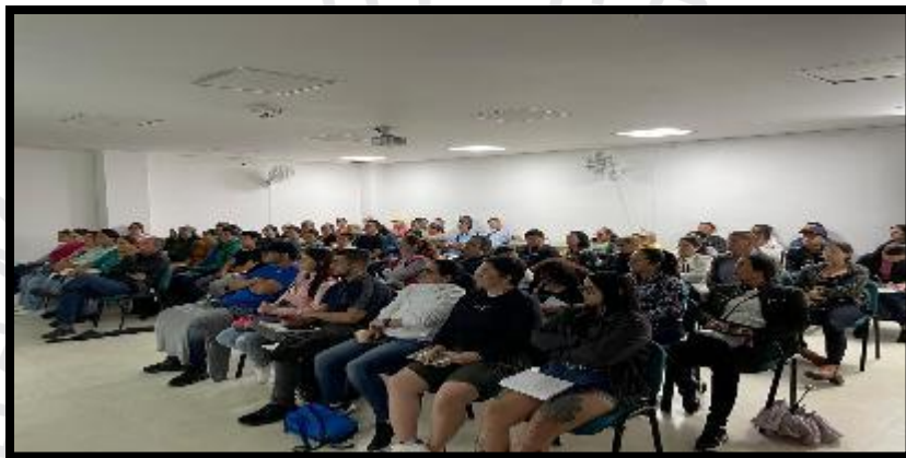
Foto 47 Capacitación Manipulación de Alimentos