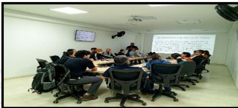
Foto 43 Capacitación Servicio al cliente - Laboratorio Gella