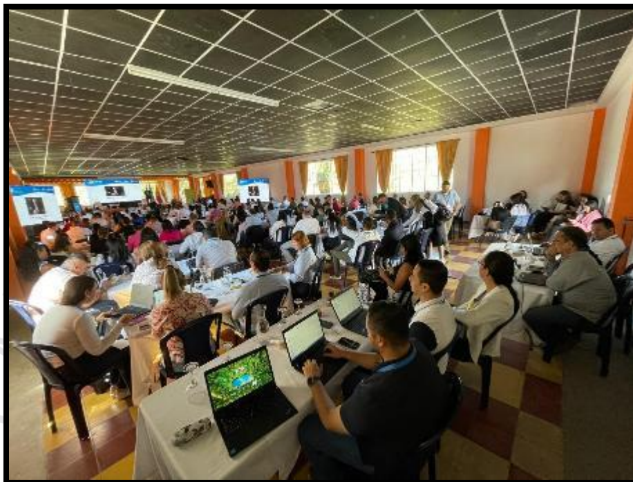
Foto 152 XXI Taller Nacional de Registros Públicos