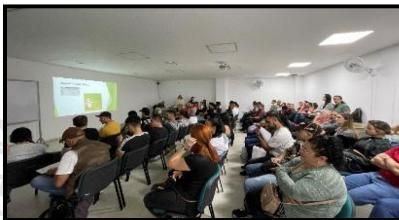
Foto 69 Capacitación Manipulación de Alimentos