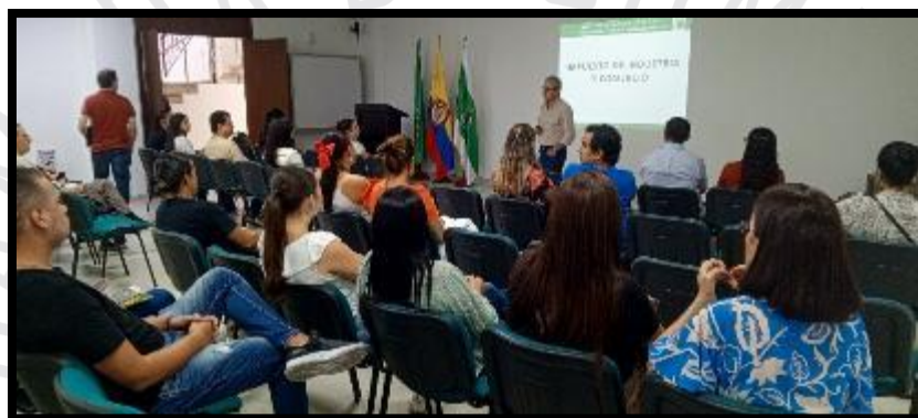
Foto 31 Capacitación pago de Industria y Comercio