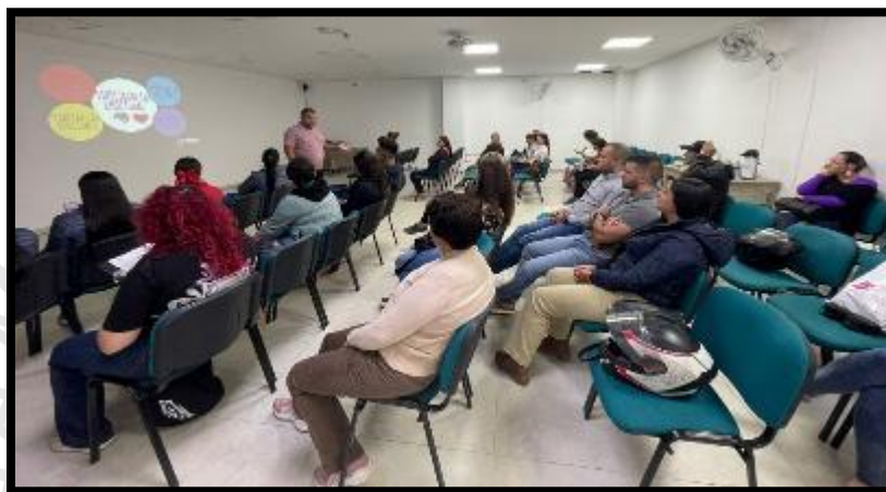
Foto 53 Capacitación Inteligencia Emocional