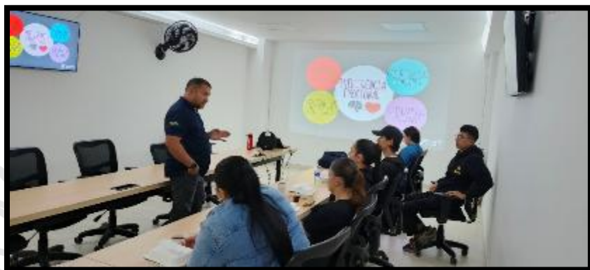
Foto 75 Capacitación Inteligencia Emocional Baldoria