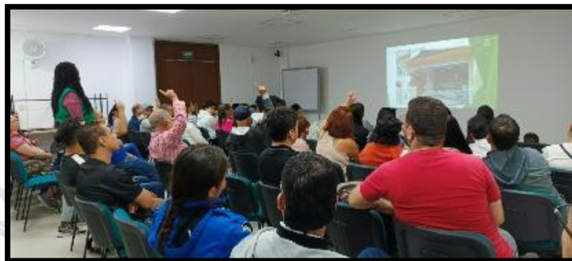
Foto 125 Capacitación Manipulación de alimentos

Foto 124 Capacitación Manipulación de Alimentos