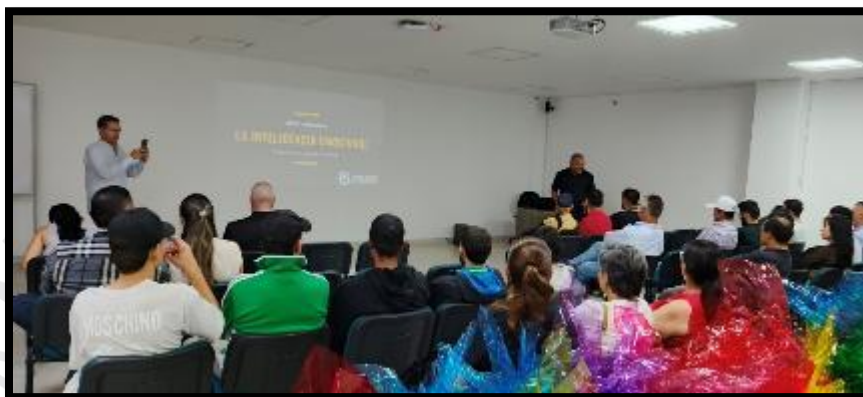
Foto 133 Capacitación Inteligencia Emocional