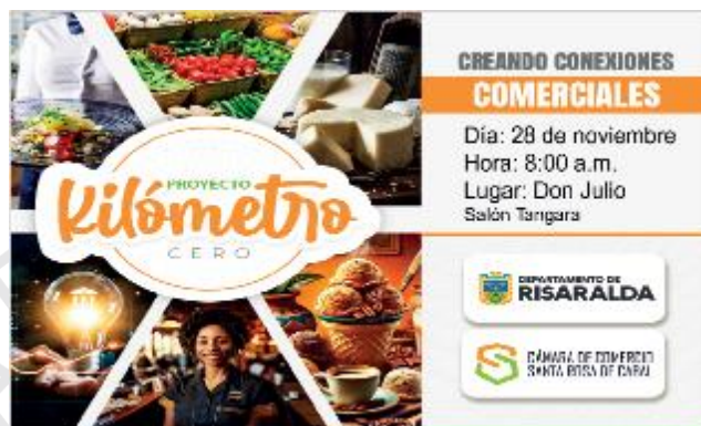
Ilustración 10 Convocatoria Kilómetro 0