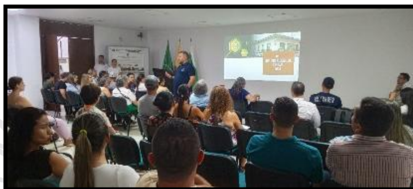
Foto 27 Capacitación Registro Nacional de Turismo