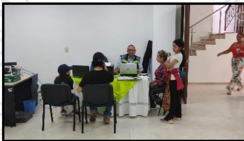
Foto 17 Asesorías Personalizadas DIAN