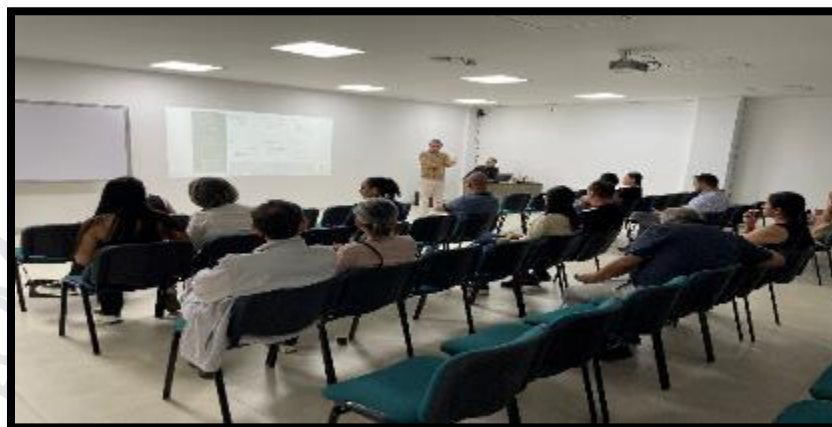
Foto 79 Capacitación Facturación electrónica