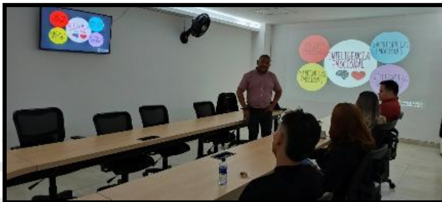
Foto 113 Capacitación Inteligencia Emocional

Foto 112 Capacitación Inteligencia Emocional