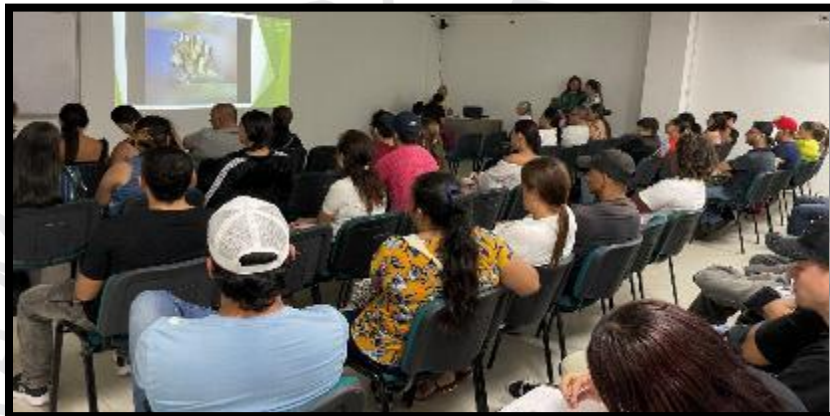
Foto 71 Capacitación Manipulación de alimentos

Foto 70 Capacitación Manipulación de alimentos