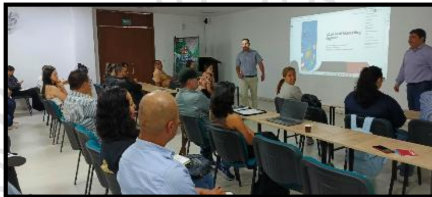
Foto 162 Marketing Digital para emprendedores