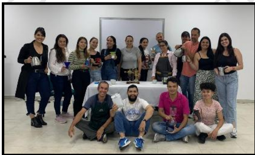
Foto 139 Taller Barismo

Asistentes: 12 personas certificadas por el SENA