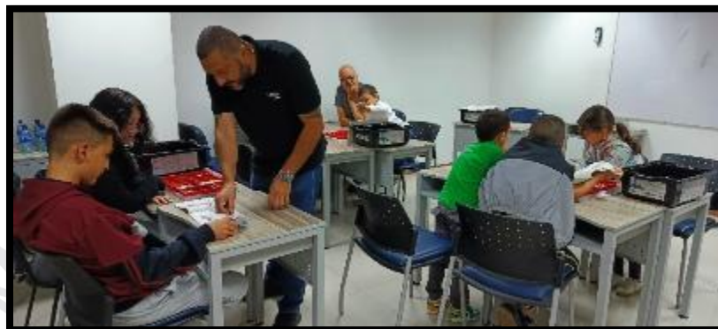
Foto 121 Capacitación Taller de robótica