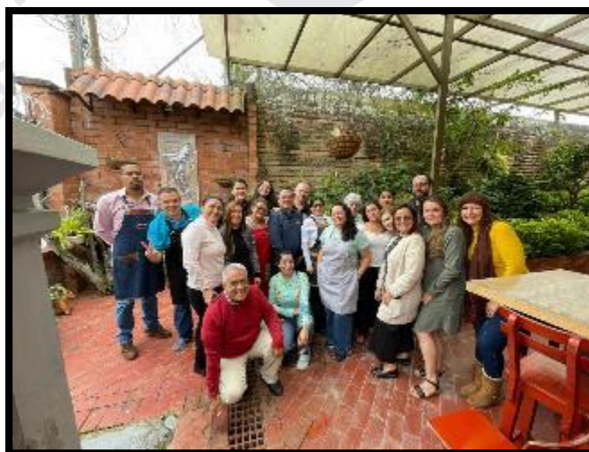
Foto 141 Taller Café Espresso

Asistentes: 20 personas certificadas por el SENA