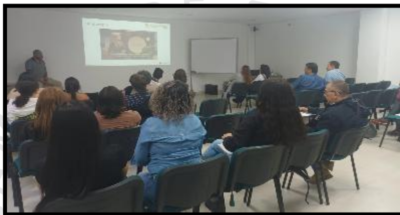
Foto 164 Taller pitch