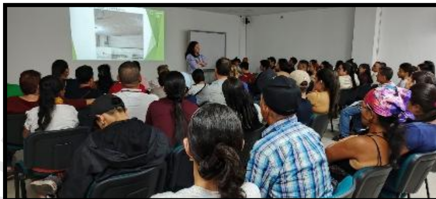
Foto 105 Capacitación Manipulación de alimentos

Foto 104 Capacitación Manipulación de alimentos