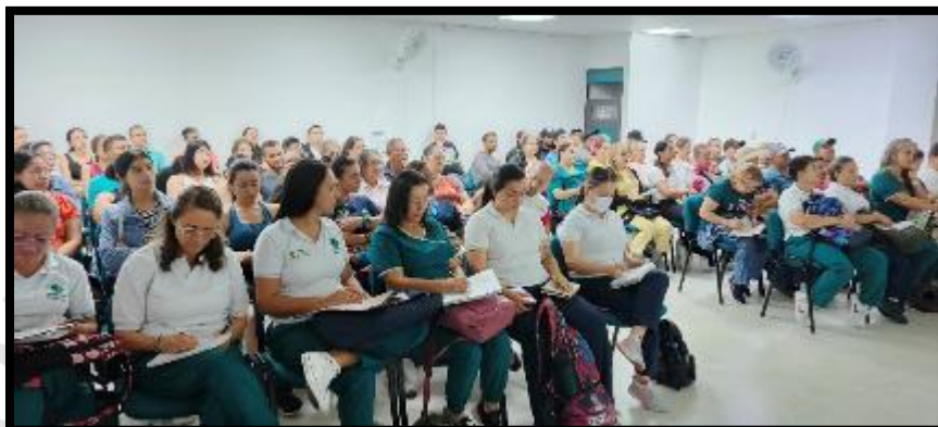
Foto 93 Capacitación Manipulación de Alimentos

Foto 92 Capacitación Manipulación de Alimentos