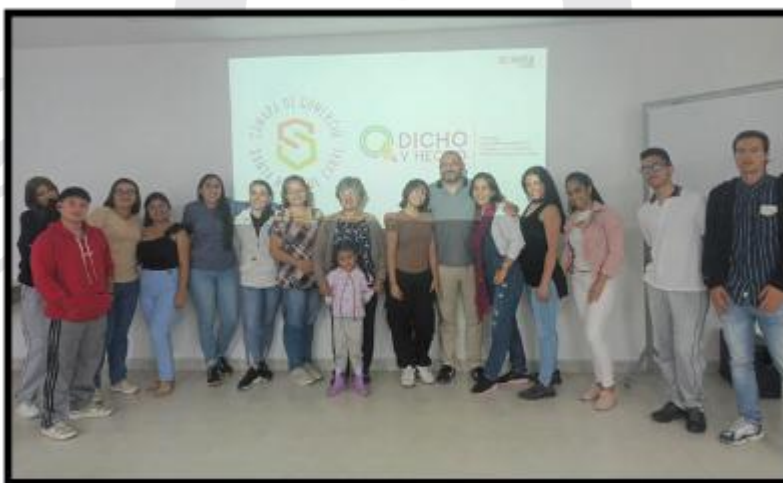
Foto 153 Ruta de Emprendimiento Fase I

Se concluyó el programa con 15 emprendedores formados donde pudieron pasar su emprendimiento a un segundo nivel.