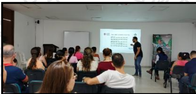
Foto 156 Taller de orientación para emprendedores con el SENA