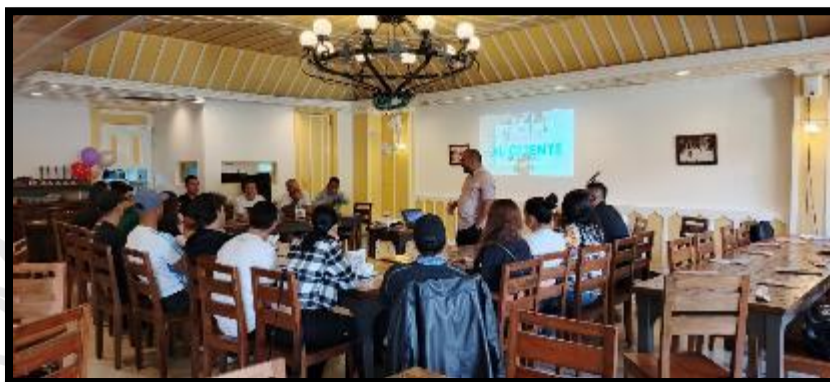
Foto 137 Capacitación Servicio al cliente