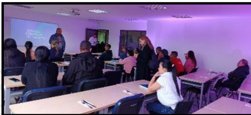
Foto 117 Capacitación en los detalles está el buen servicio y marketing digital