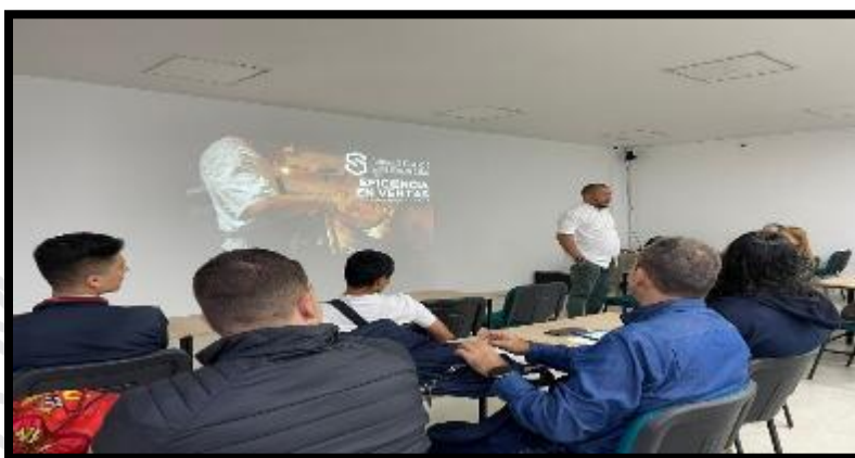
Foto 103 Capacitación eficiencia en ventas