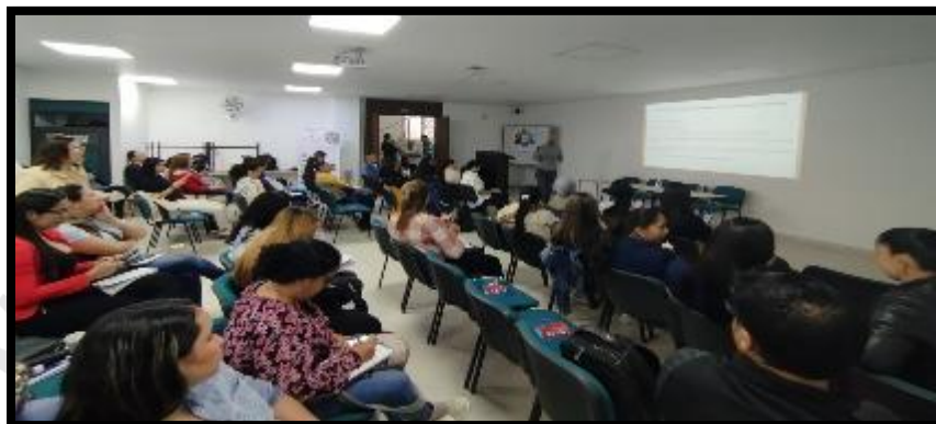
Foto 123 Capacitación conversatorio Trabajador incapacitado

Foto 122 Capacitación conversatorio Trabajador incapacitado