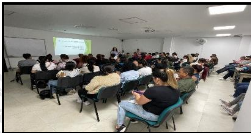
Foto 77 Capacitación Manipulación de alimentos