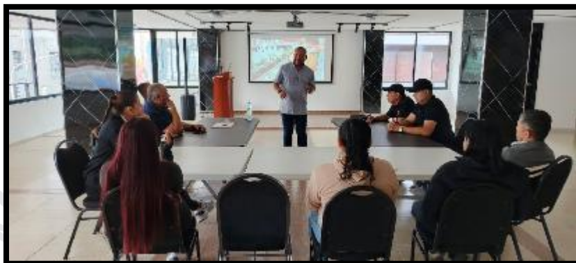
Foto 127 Capacitación Servicio al cliente

Foto 126 Capacitación Servicio al cliente