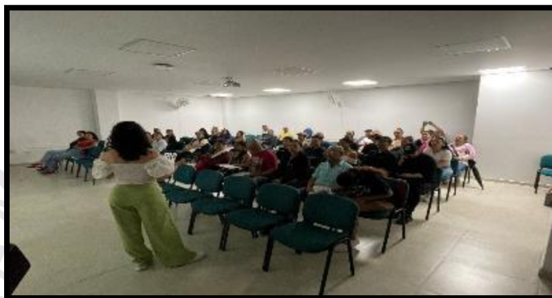
Foto 83 Capacitación Manipulación de Alimentos