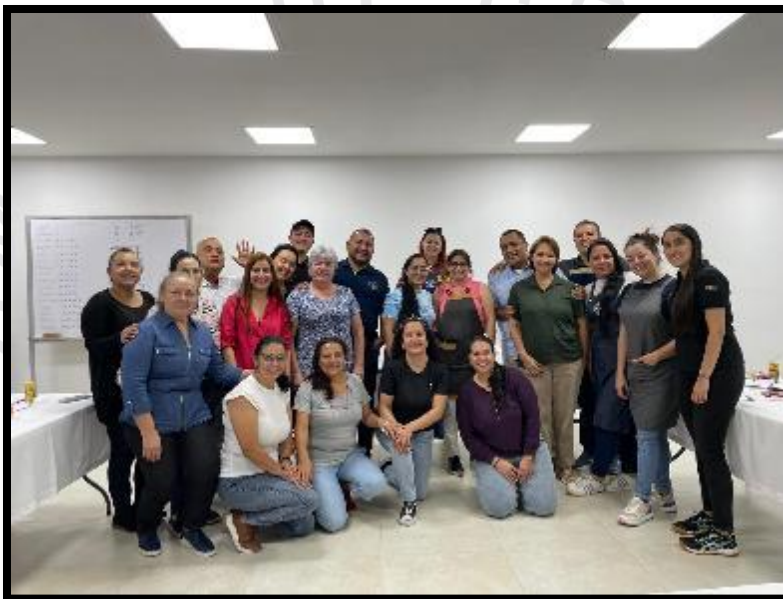
Foto 138 Capacitación desarrollo de habilidades sensoriales para café

Asistentes: 17 personas certificadas por el SENA