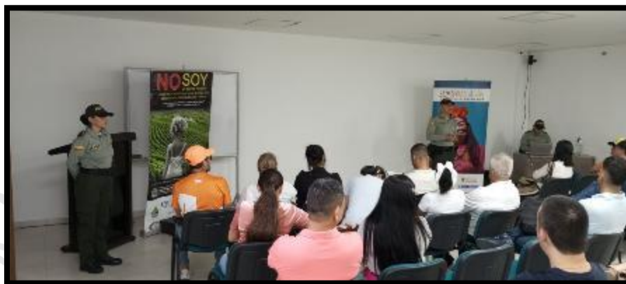
Foto 95 Capacitación Seguridad con Policía de turismo para prestadores de turismo