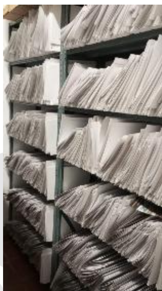
Foto 6 Archivo Central principio 2024