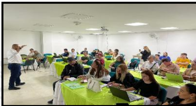
Foto 49 Capacitación Inteligencia Artificial