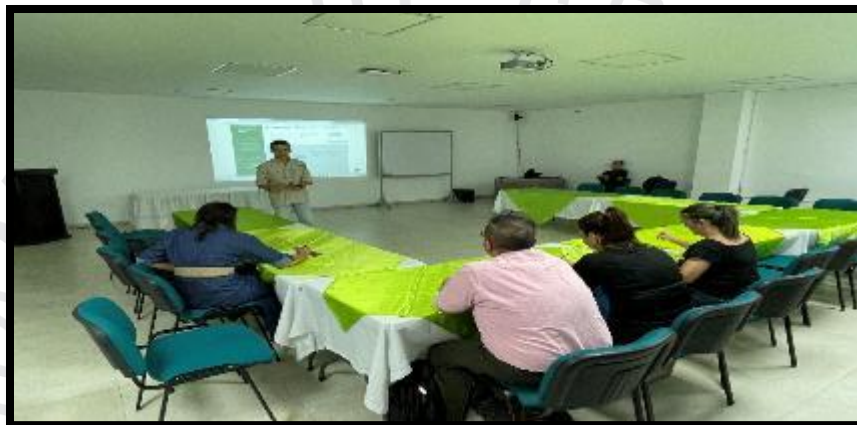
Foto 81 Capacitación Régimen Simple de Tributación