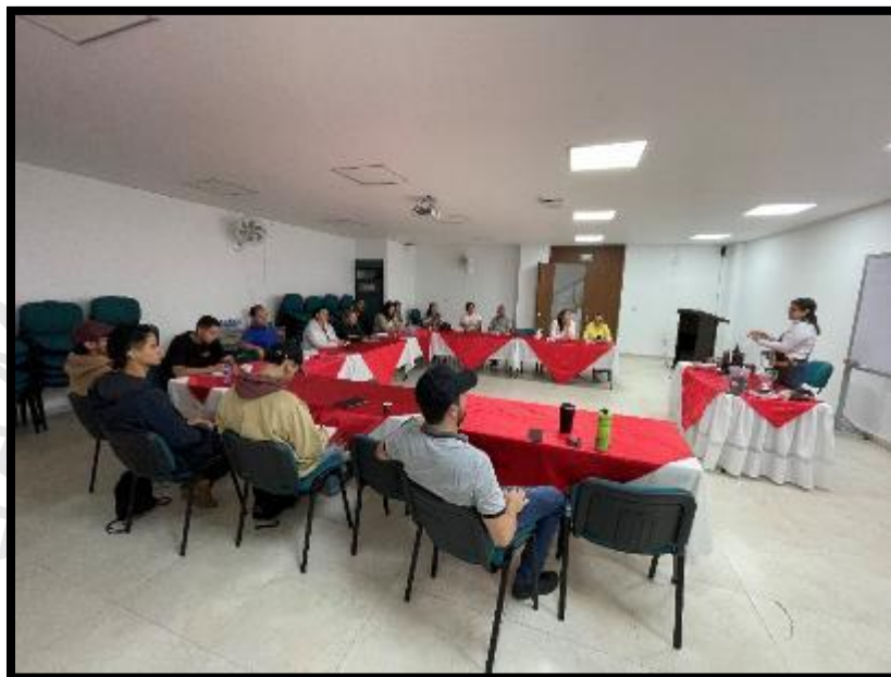
Foto 140 Taller Barismo

Asistentes: 18 personas certificadas por el SENA