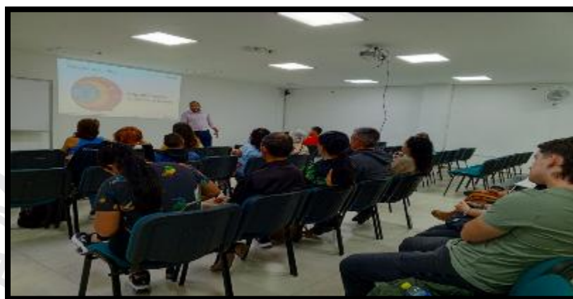
Foto 45 Capacitación Propósito Superior