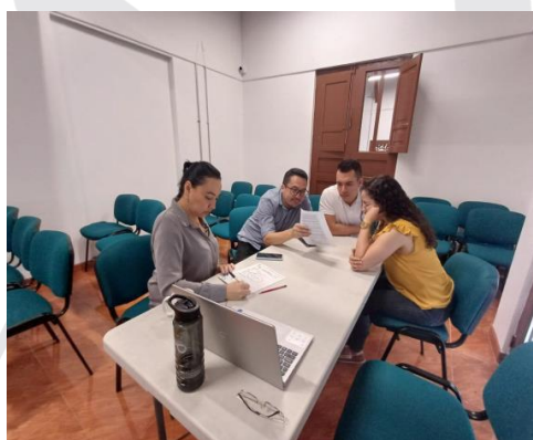
Foto 12 Reunión COPASST integrantes comité CCSRC

Los integrantes de los comités fueron capacitados en temas de importancia, como investigación de accidentes, riesgos laborales, actos y condiciones inseguras, riesgo biomecánico, auditoría al SG-SST, resolución 0312 de 2019, resolución de conflictos, riesgo psicosocial, entre otras.