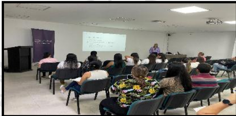
Foto 85 Capacitación Renta Persona Naturales