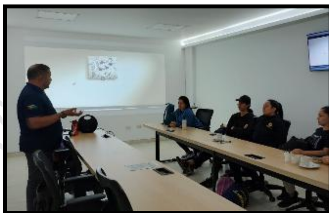
Foto 61 Capacitación Técnica de ventas Cap. Personalizada "Pie Canela"