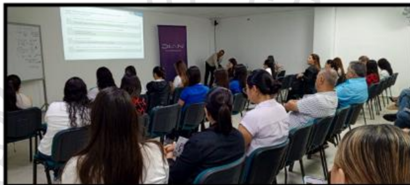
Foto 41 Capacitación Novedades Renta Jurídicos ley 2277 y reporte de información exógena año gravable 2023