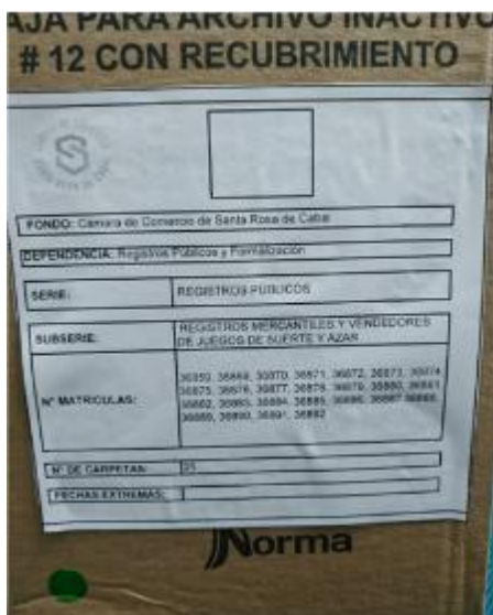
MARCACIÓN DE GAVETA