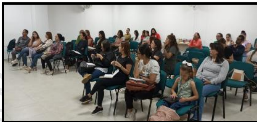
Foto 67 Capacitación acuerdos de desalarización con los trabajadores