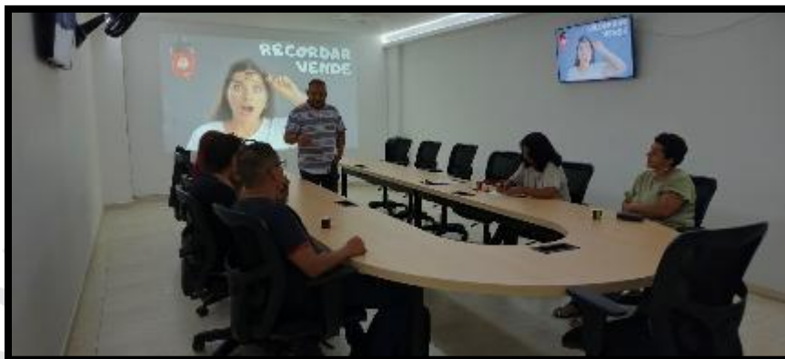
Foto 109 Capacitación técnica en ventas